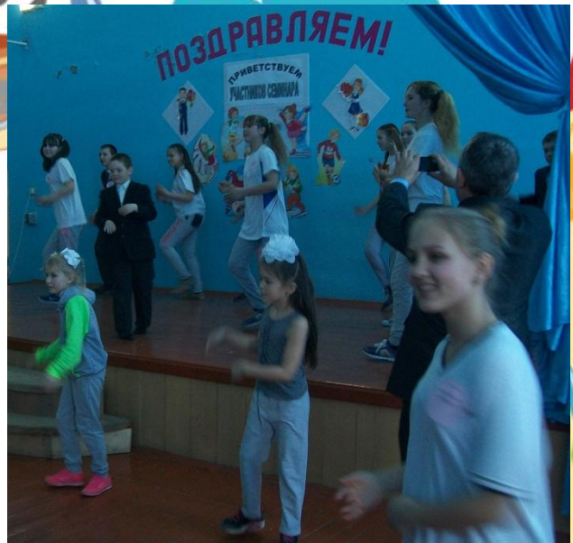
Выступление агитбригады «Парус»