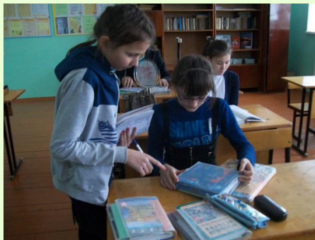
Операция «Живи книга»