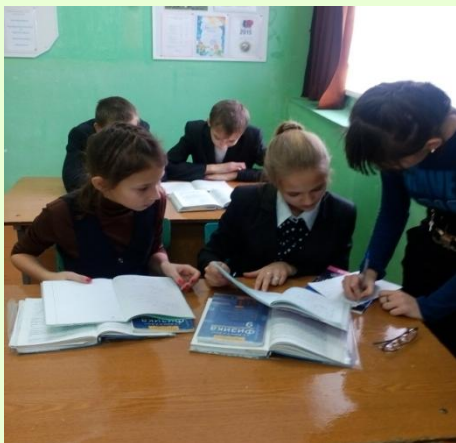
Проверка школьных принадлежностей